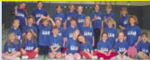
„die kleinen Mairocker“ - der Jugendclub die Freiwillige Feuerwehr - der Männerchor „Liedertafel“ „Rock im Mai“ Open-Air-Festival