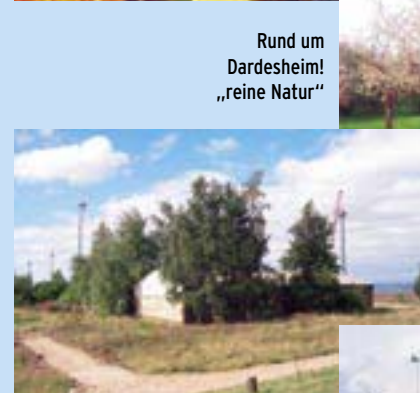
Rund um Dardesheim! „reine Natur“