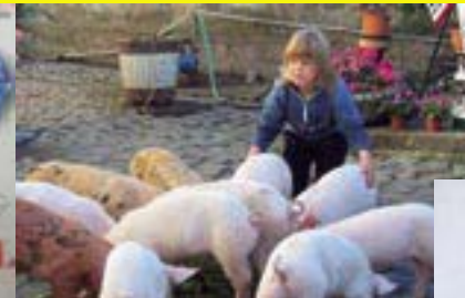
In der Stadt Dardesheim noch anzutreffen! „Ländliche Idylle“