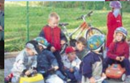
Zukunft in der Stadt Dardesheim! Kinder!!!