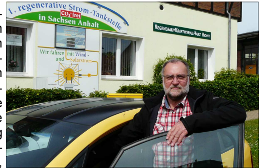
Der Dardesheimer Bürgermeister ist stolz auf die Dardesheimer Auszeichnung als „Energie-Kommune“ und lädt alle Bürgerinnen und Bürger beim Kirchplatzfest zum gemeinsamen Feiern ein

mer Umweltpreis werden wir die besten Projekte weiterhin fördern und honorieren. Die neue bundesweite Auszeichnung ist für uns weiterer Grund, am 20./21. Juni auf dem Kirchplatzfest in diesem Sinne zünftig gemeinsam zu feiern. Alle sind dazu herzlich eingeladen!